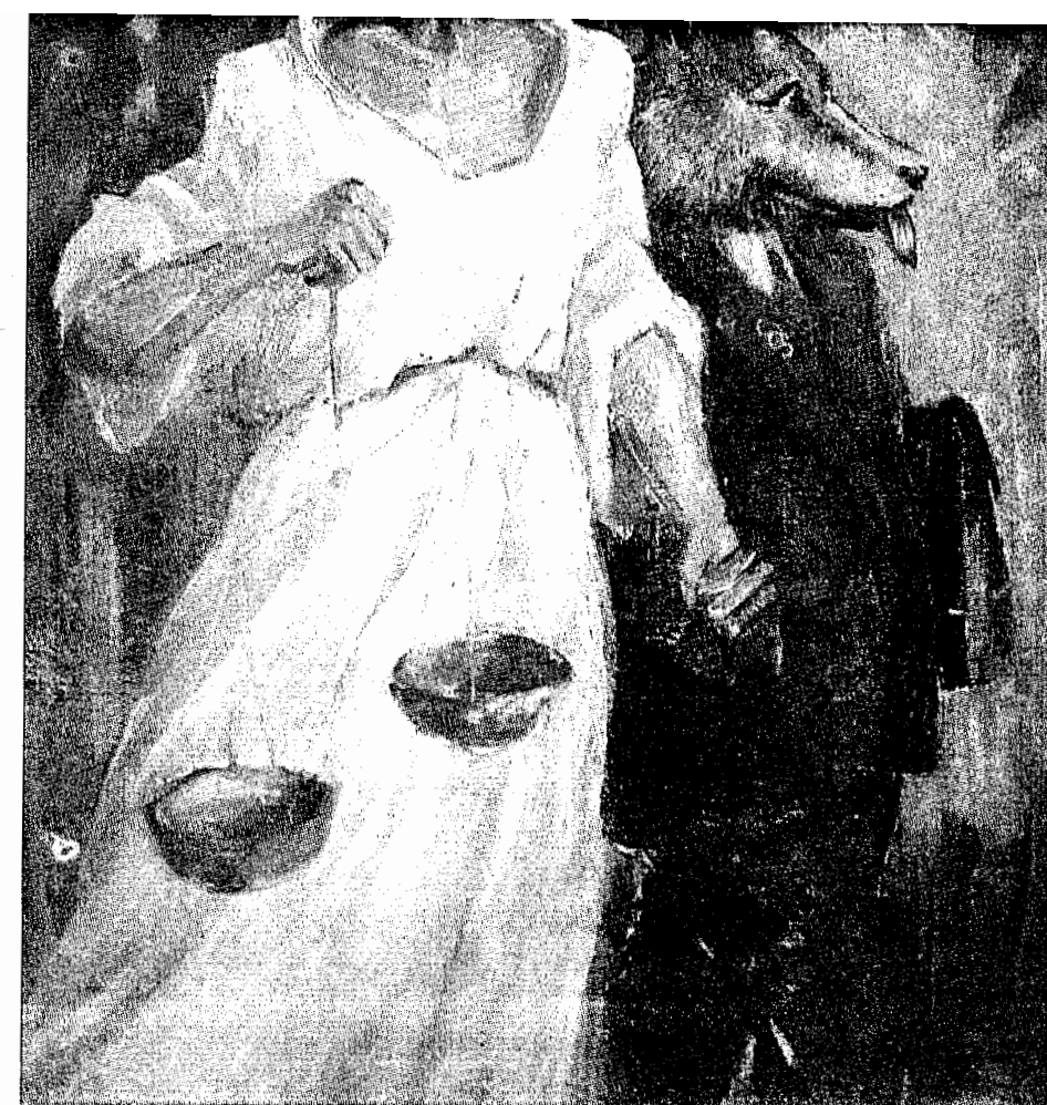
Tavlan "Blind tillit" var ett av de verk som visades på polishuset i Stockholm.