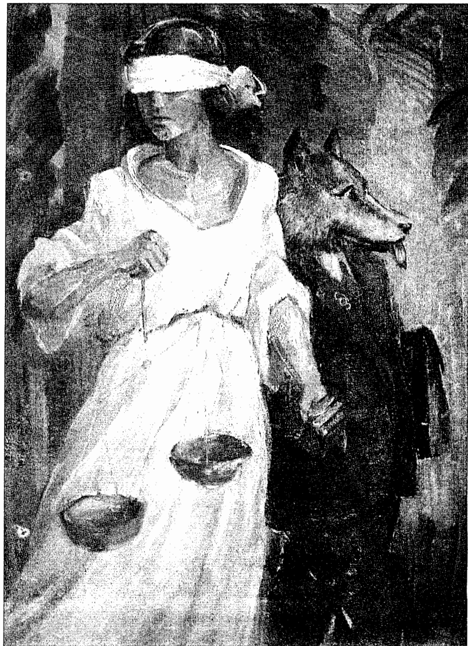
Tavlan "Blind tillit" var ett av de verk som visades på polishuset i Stockholm.